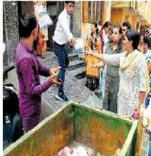
वाड-3 में प्लास्टिक की खाली बोतलें-पॉलीथिन लीं।