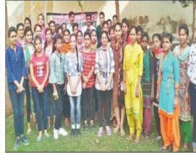
आईबी स्नातकोत्तर महाविद्यालय की छात्राओं द्वारा की गई सफाई।

प्राचार्य ने कहा कि भारत में प्रत्येक वर्ष 1 करोड़ 40 लाख टन प्लास्टिक का प्रयोग करते हैं। जिसका हम एक बार प्रयोग करने के बाद कचरे में फेंक देते हैं। जैसे पॉलीथिन, प्लास्टिक बोतलें आदि इसको जलने से पूरा और जलने जंतु वाहक प्रमुख शत्रु होते हैं। इसके जलने से मिथेन जैसी भयंकर गैस निकलती है। जो कि वायु प्रदूषण फैलाती है। इससे कैंसर जैसी भयंकर बीमारी होती है। प्राचार्य ने इस अभियान में 2 घंटे प्रयत्न करके प्लास्टिक