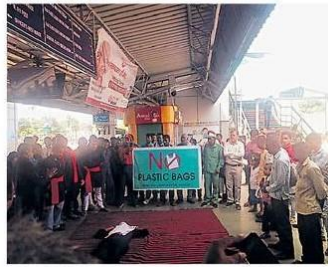
पानीपत, रेलवे स्टेशन परिसर में नुकड़ नाटक प्रस्तुत करके मिलात यूज प्लास्टिक के खिाफ जागरूक करते कलाकार।

रेलवे स्टेशन में नुकड़ नाटक के माध्यम से बहुत सुंदर तरीके से स्वच्छता का महत्व बताया। साथ ही प्लास्टिक प्रयोग से होने वाले नुकसान के बारे में अवगत कराया गया। कैंसेर पर मौजूद यात्रियों में शायद भी ली कि वे सिंगल यूज प्लास्टिक प्रयोग नहीं करेंगे। स्वयं भी स्वच्छता रखें और अन्य को भी प्लास्टिक का प्रयोग नहीं करने के लिए प्रेरित करेंगे। स्टेशन आगीक्षक शीटज करण ने उत्तर रेलवे की ओर से यात्रियों को कपड़े