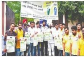
रैली निकलकर मार्गों को गुजर के रैली में जनसहरी रैली संचालन के सत्य।

जागरूकता रैली का आयोजन किया गया। कार्यक्रम में सहियर विचारधर्मों के प्रति लक्ष्य 'स्वच्छता ही सेवा, एक मिशन' का निगम पानीपत, सार्वजनिक संस्था निगम, द परिवार, प्रगति पानीपत निगम, कल्याण समिती, पानीपत महिला अल्प समाजिक संस्थाओं के संयुक्त तत्वावधान में 'स्वच्छता ही सेवा, एक मिशन' विषय पर जागरूकता रैली का आयोजन किया गया। कार्यक्रम में सहियर विचारधर्मों के प्रति लक्ष्य 'स्वच्छता ही सेवा, एक मिशन' का निगम पानीपत, सार्वजनिक संस्था निगम, द परिवार, प्रगति पानीपत निगम, कल्याण समिती, पानीपत महिला अल्प समाजिक संस्थाओं के संयुक्त तत्वावधान में 'स्वच्छता ही सेवा, एक मिशन' विषय पर जागरूकता रैली का आयोजन किया गया।